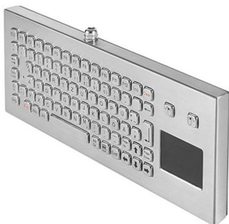
Beispiel Desktop Variante: NHKT-B361-TP-FN-DT-DWP