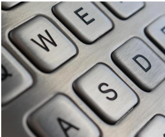
Version B (mit flachen Tasten)