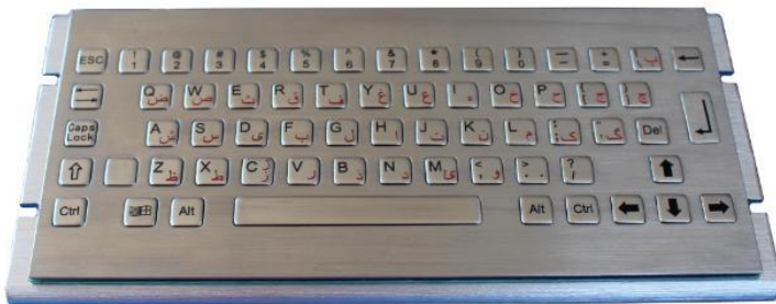
B-Version mit flachen Tasten