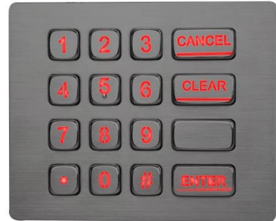
Option mit Hinterleuchtung