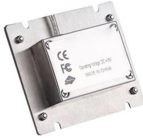
Schnittstellen Kabelanschluss (Optional)