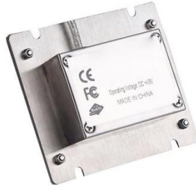
Schnittstellen Kabelanschluss (Optional)