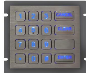
Option mit Hinterleuchtung