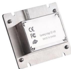
Schnittstellen Kabelanschluss (Optional)