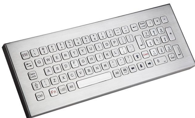
Desktop Version: NHKT-B340-KP-DT-DWP

Als Desktop Variante: NHKT-B340-KP-FN-DT-DWP