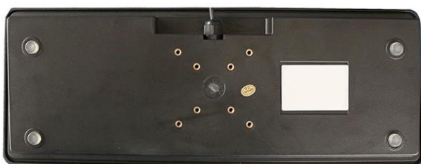
Befestigung nach VESA Norm