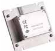
Schnittstellen Anschluss USB, PS2, RS232, RS485