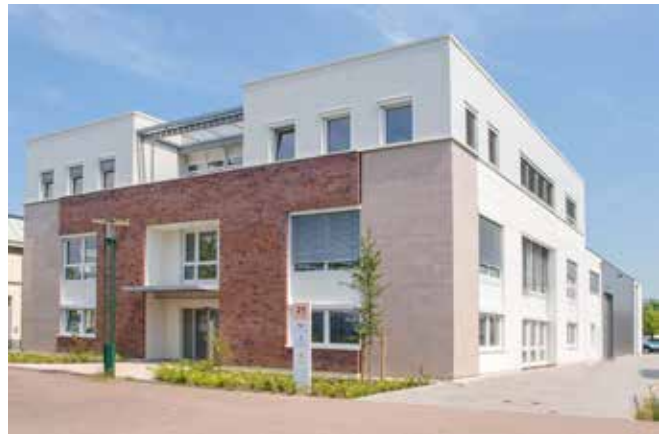
Firmensitz im Stahlwerk Becker in Willich

Unsere Fertigung erfolgt wirtschaftlich in ausgewählten Produktionswerken, hauptsächlich in China. Dabei sind unsere Produktionswerke nach DIN ISO 9001, DIN ISO 14001, ISO TS 16949 bzw. DIN ISO 13845 zertifiziert. Die europäischen Qualitätsstandards unserer Produkte werden durch ein umfassendes Qualitätsmanagementsystem in den Produktionswerken und im eigenen Haus gewährleistet.