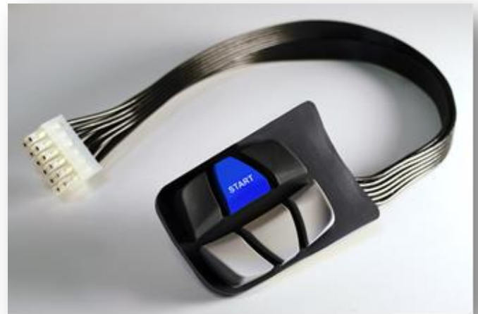
Beispiel einer kundenspezifischen, wasserfesten Baugruppe.

Das genaue Anforderungsprofil stimmen Sie im Anschluss gemeinsam mit unseren Ingenieuren ab, die Ihnen gerne kurzfristig ein Angebot erstellen.